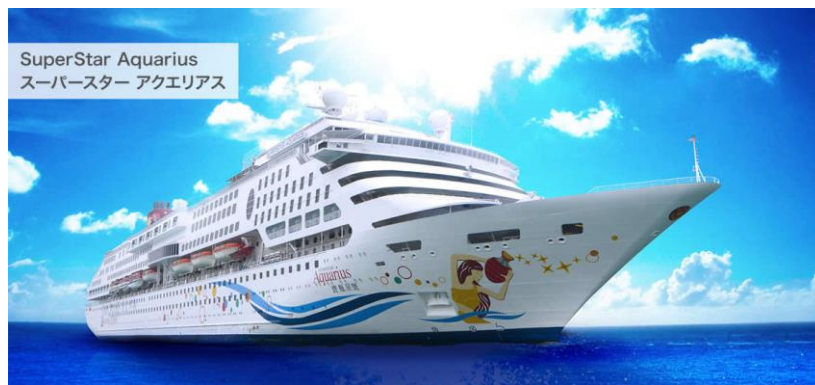
スーパースターアクエリアス

寄港した時間は 16 時で少し遅かったのですが、船客の皆さんは下船後すぐにそれぞれ思いの観光地へ出かけていきました。